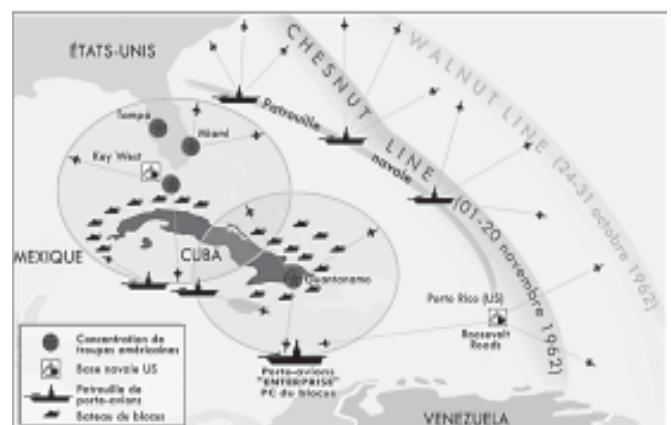
Carte du blocus naval de Cuba en octobre 1962