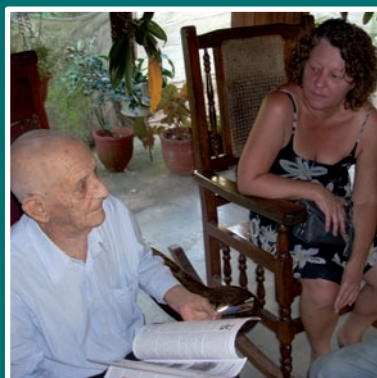
» Robaina p6