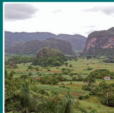
» Pinar del Rio p12