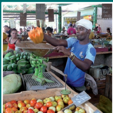
» Actua p4