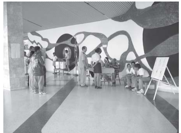
bureau de vote aéroport Santiago